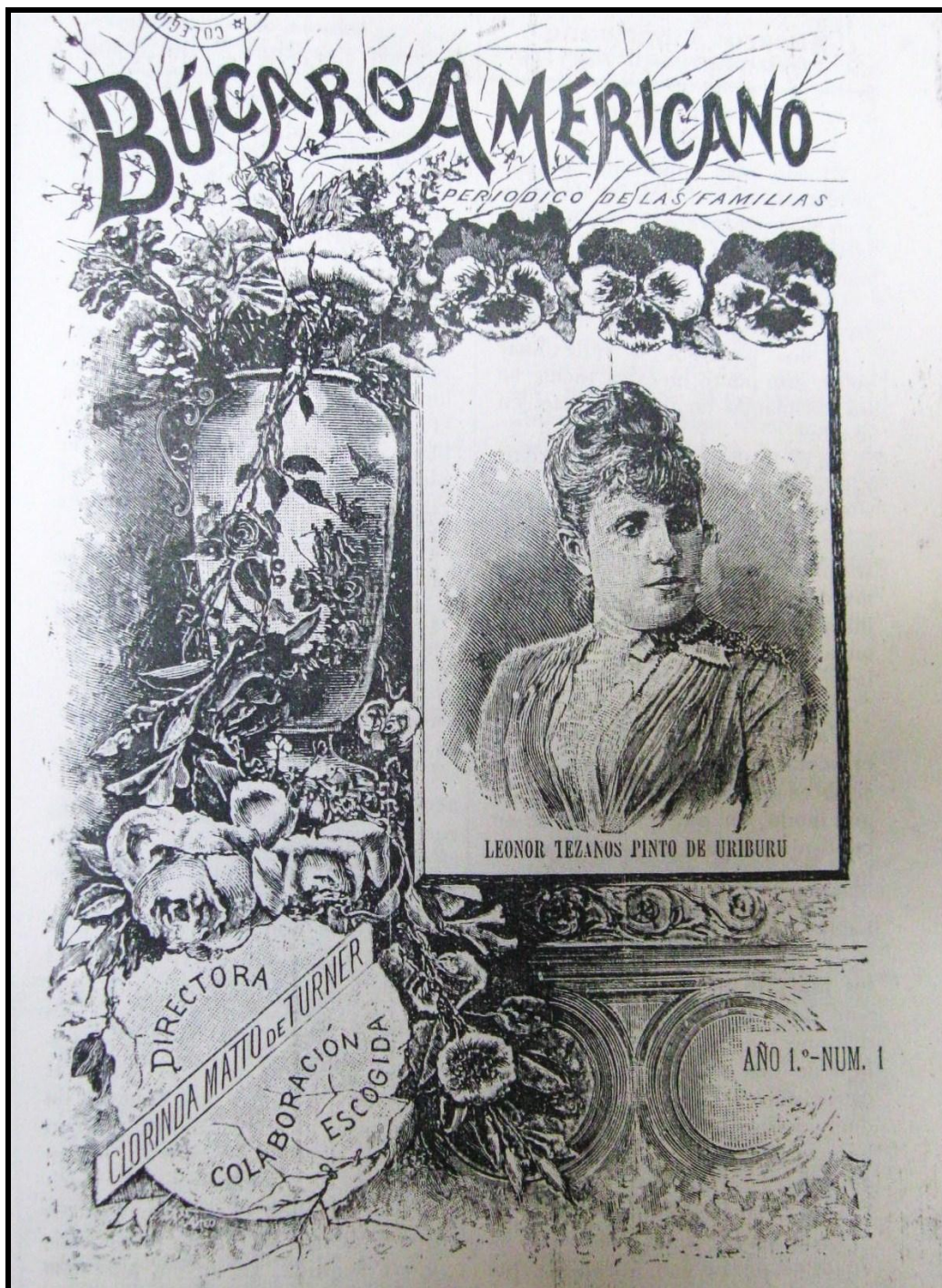
Imagen 3: Tapa de Búcaro Americano , 1 de febrero de 1896, n°1.