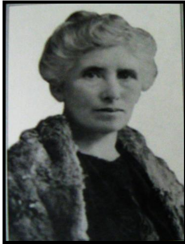
Imagen 7: Grabado de Silvia Fernández