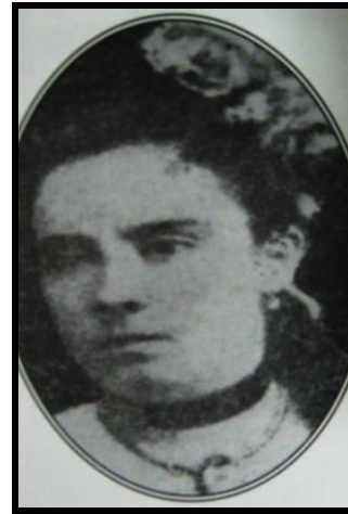
Imagen 8: Grabado de Agustina Andrade