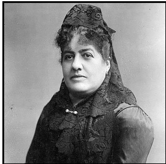
Imagen 6: Grabado de Clorinda Matto de Turner