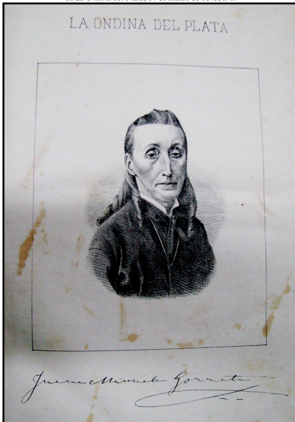
Imagen 4: Grabado de Juana Manuela Gorriti publicado en La Ondina del Plata , 14 de marzo de 1875, n°6.