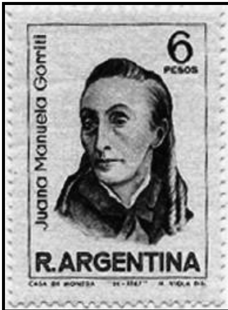
Imagen 5: Estampilla de Juana Manuela Gorriti