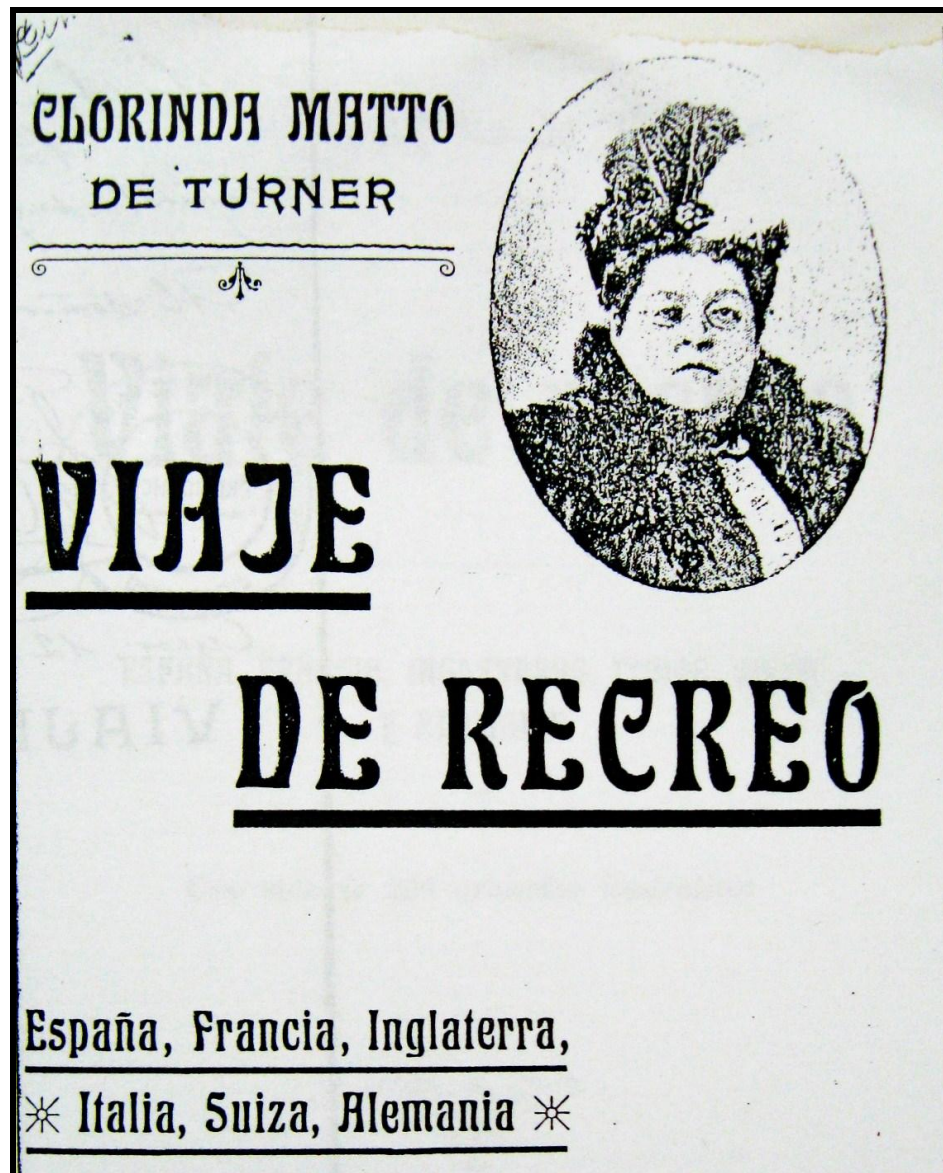
Imagen 11: Tapa original de Viaje de recreo de Clorinda Matto de Turner (1909)