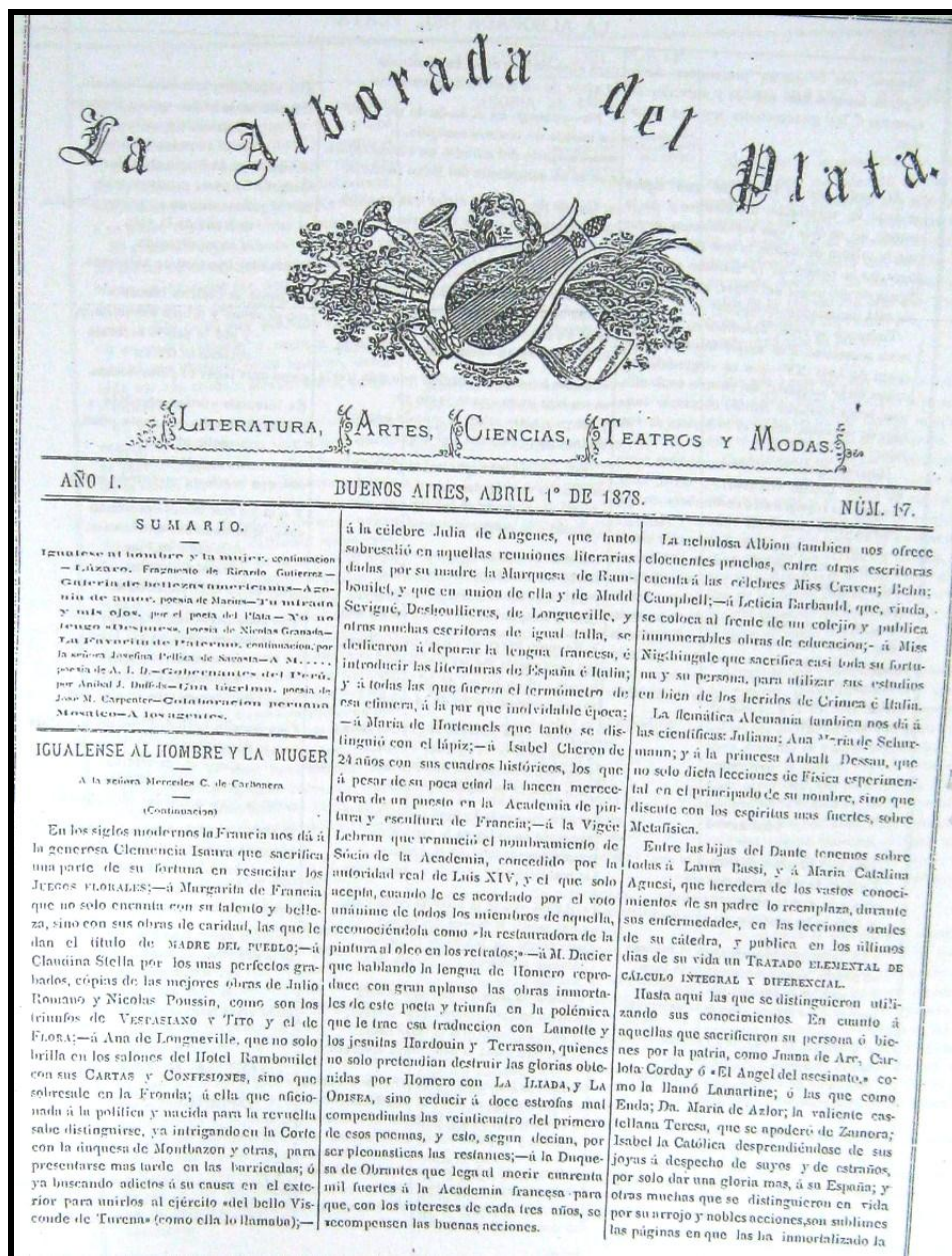
Imagen 1: Tapa de La Alborada del Plata , 1 de abril de 1878, n° 17.