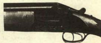
Escopeta en posición de enviar la ideología.