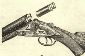
Carga de la ideología.