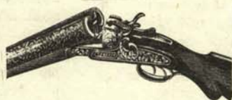
Escopeta en posición de recibir la ideología.

Es fácil, cómodo y eficaz. Consiste en cargar los dos cañones de su escopeta con la ideología preferida. Dispárela después a bocajarro sobre la obcecación de su interlocutor y complete de esa manera el ciclo dialéctico.