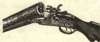
Escopeta en posición de recibir la ideología.

Es fácil, cómodo y eficaz. Consiste en cargar los dos cañones de su escopeta con la ideología preferida. Dispárela después a bocajarro sobre la obcecación de su interlocutor y complete de esa manera el ciclo dialéctico.