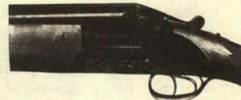
Escopeta en posición de enviar la ideología.